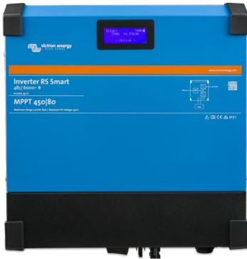
Inversor RS Smart 48/6000